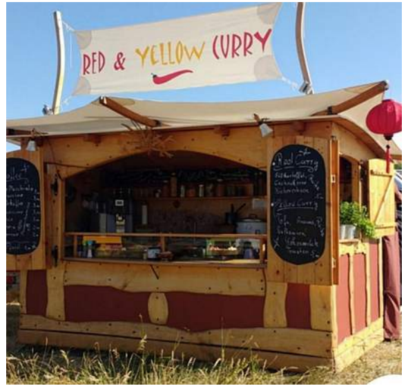
Leckerer vom Curry-Stand